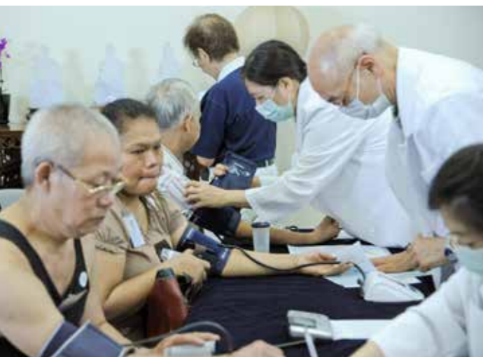
■ 醫護人員為民眾量測血壓。