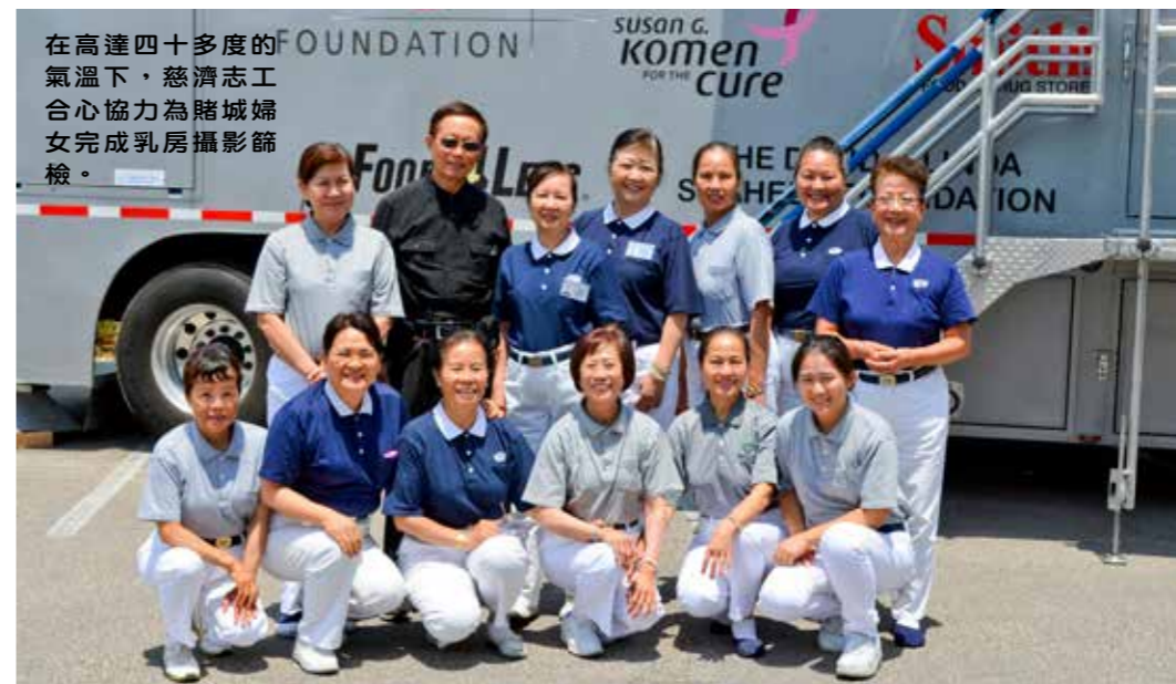
在高達四十多度的氣溫下，慈濟志工合心協力為賭城婦女完成乳房攝影篩檢。