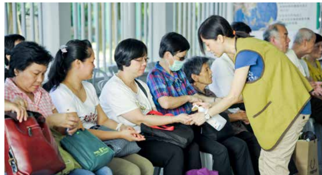
香港大圍聯絡處義檢活動，慈濟志工為等候看診的民眾消毒雙手。

「高永文局長現在正過來關懷我們這次義檢！」當大家正忙著服務民眾時，志工捎來喜訊。曾經多次參與香港義檢活動、對慈濟非常認同的高永文醫師，目前是香港特別行政區食物及衛生局局長，他在忙碌行程裡抽空前來關懷受檢的民眾，為現場醫護人員打氣。