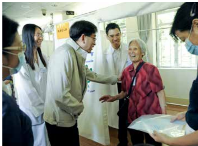
■ 香港食物及衛生局高永文局長（左二）前來為慈濟義檢活動打氣，親切地與民眾寒暄慰問。

高局長逐一走到每個科別，慰問正在候檢的民眾，了解他們的健康，有位老伯伯趁機讓高局長為他檢查身