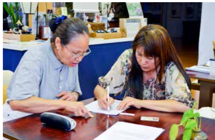
■ 當受檢人不諳英文時，慈濟志工會協助翻譯並代為填寫表格，甚至登上巴士回答醫護的問診。