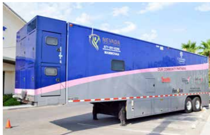
■ 搭載乳房X光攝影器材的「曼妙巴士」，再度行駛到慈濟拉斯維加斯會所提供篩檢服務。

女提供每年一次的乳房攝影。巴士服務對象是年收入低於平均值的弱勢婦女，預擬計劃、定點定時進行篩檢，受檢單位的要件是有一個寬闊的停車場以便泊車。經驗豐富的X光技術員隨車服務，並邀請內州的放射線專科醫師判讀報告；病人會在受檢二至三週後收到報告。萬一乳房發生病變，內