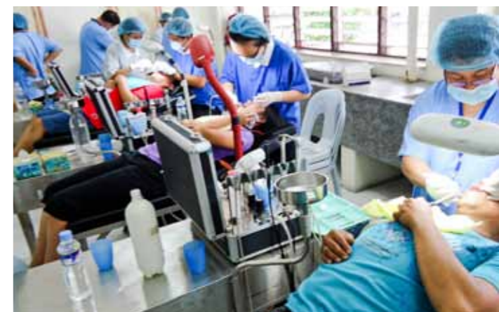
由托雷斯上將率領的國軍牙醫團隊也加入義診的行列，他認為能夠履行服務同胞的誓言，讓他們很有成就感。

此次義診共動員一百一十一位醫護人員、十二位牙科助理及四百三十八位華人與本土志工，各科別的病患包括內