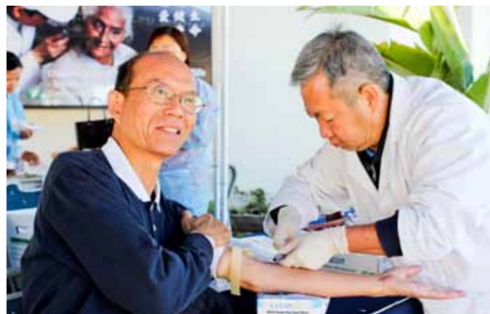
■ 美國慈濟醫療志業為慶祝十九周年，舉辦「守護法親健康日」活動，仔細為每一位志工的健康把關。

醫療志業基金會執行長曾慈慧表示：「醫療志業體首次為法親的健康把關，平時志工常忙於家業、事業和志業而疏於照顧自己。醫療志業經過多次評估和策劃，決定藉由法親健康日的活動，來關懷志工與其親友們，希望志工照顧自己的健康、守護自己的生命！」