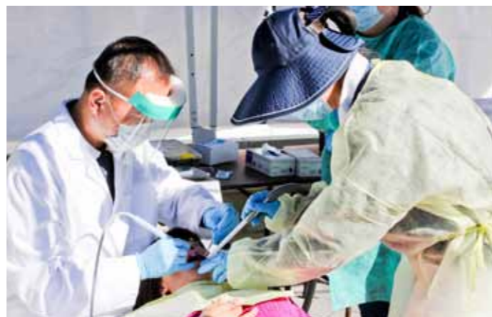
■ 除了志工之外，家屬也是義診的對象，圖為人醫會牙醫師正在為志工家屬檢查牙齒。