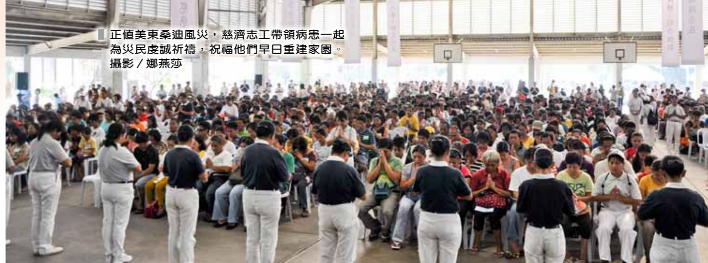
正值美東桑迪風災，慈濟志工帶領病患一起為災民虔誠祈禱，祝福他們早日重建家園。

人，我們聖多明哥里也曾受慈濟幫助，因此聯絡電視臺來報導慈濟的義診是我表達感恩的方式。」