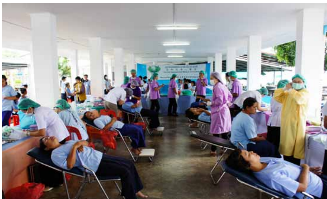
在牙科義診區，醫護人員認真地為她們治療牙齒。

帶動團康，無論是教導太極拳、慈濟歌選「一家人」的手語表演，或是把真誠的擁抱送給她們每一位。有受刑人分享，進來這裡之後，父母親因為家庭貧窮的關係，無法常常來看她，讓自己更有想家的感覺。但今天跟志工互動之後，能夠稍稍減輕那種感覺；同時得知這一群志工，有些是從遠方來的，還願意為泰國這一塊土地付出。有一天如果她們出去之後，也會跟志工一樣，學習為別人無所求地付出。