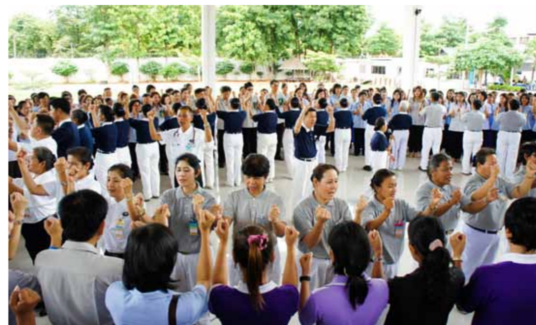
■ 志工們與受刑人圍成一個大圓圈，一起比著手語《一家人》。