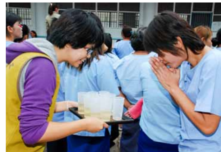
■ 志工在候診區為等候看診的受刑人奉茶，與她們親切互動。

泰國分會的師兄姊們在凌晨四點多從曼谷分會出發，前往叻丕府挽才攬醫院跟當地志工集合，再前往叻丕府女子監獄進行關懷與義診。開幕儀式當中，慈濟師兄姊除了為貴賓和監獄管理人員奉茶之外，還體貼地為每位女受刑人奉茶、親切問候她們，展現了