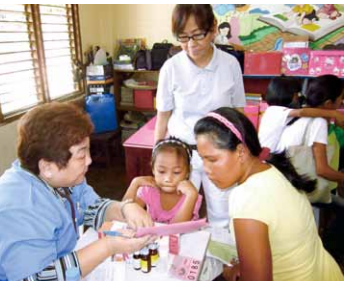
■ 醫師正在向民眾解釋病情與用藥須知。