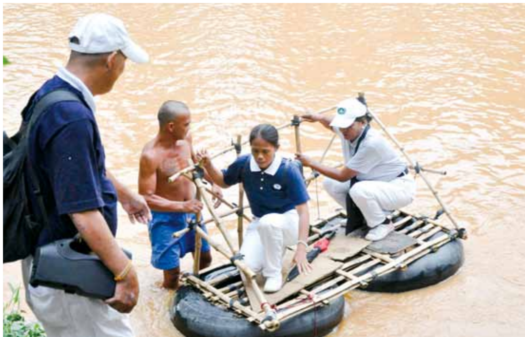
■ 義診開始前，志工搭乘簡易竹筏前往黎利省聖馬刁鎮宣傳。

菲律賓人醫會於七月一日分別在慈濟馬利僅那(Marikina)環保教育站和幸運里小學舉辦第一百五十一、二次義診，提供內科、兒科、牙科、眼科、復健科與外科共六科別的服務，當天嘉惠了多達兩千四百廿七位的貧苦病患，包括內科四百九十五位、兒科五百卅九位、牙科四百六十九位、眼科六百一十一位、復健科四十五位以及外科兩百六十八位。