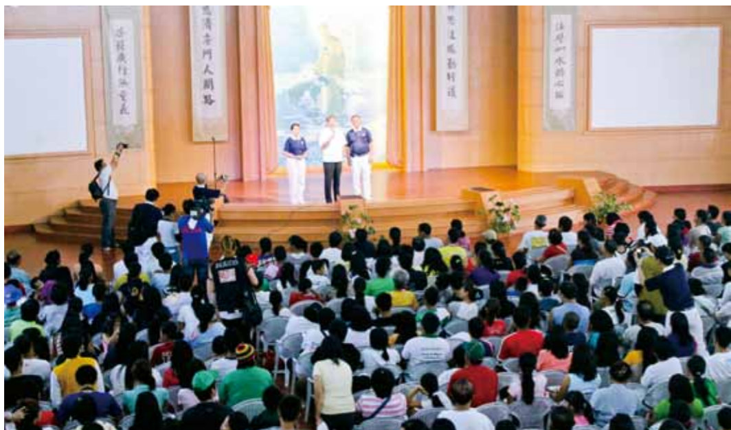
■ 馬利僅那市市長德古茲曼 (Mayor DeI de Guzman) 上臺致詞，對慈濟義診表示十分肯定，臺下坐滿了接受義診的居民。

多年來的腫塊終於除掉了。感恩慈濟基金會所有的志工及醫師，我希望上帝能保佑你們，讓你們可以幫助更多的人。」