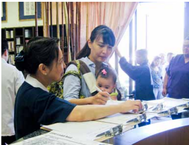
■ 慈濟志工正在協助上門求診的民衆登記看診科別。

的糖尿病病人上門，醫師為他做了糖尿病患的專屬檢查及保養，讓渾濁許久的眼珠重見光明。志工囑咐他從此以後好好保養自己的眼睛，病人則希望慈濟能定期舉行健康日，守護民衆的健康。