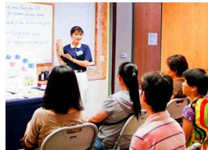
■ 慈濟志工拿起竹筒，向候診的民眾解說「竹筒歲月」的涵義。