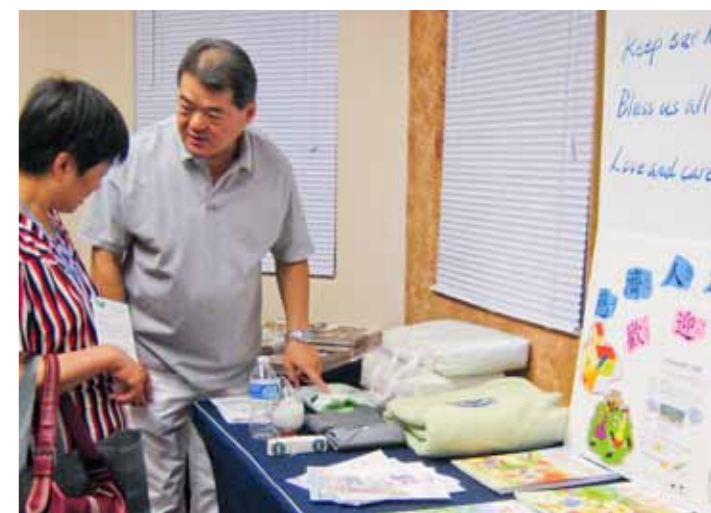
■ 慈濟環保志工向民眾介紹並推廣大愛感恩科技的環保產品。