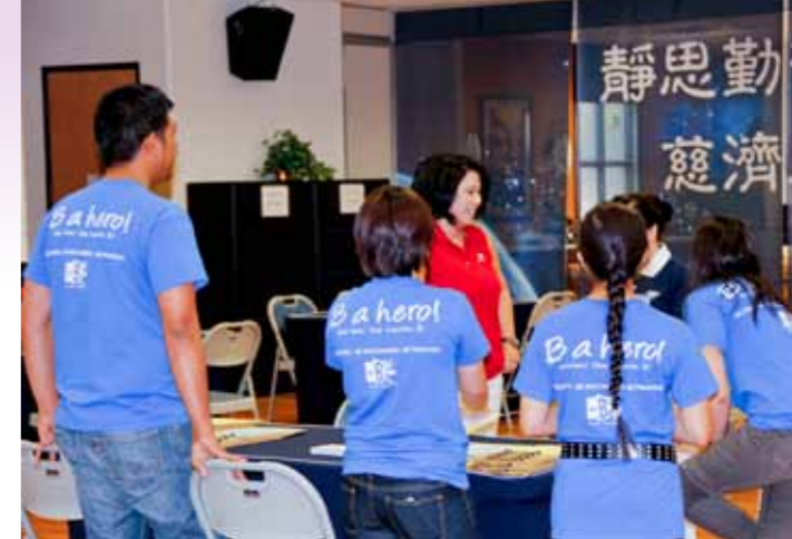
■ 「健康日」開始前，推動B型肝炎篩檢的本地團體HepBfreeLV志工也來幫忙共襄盛舉。