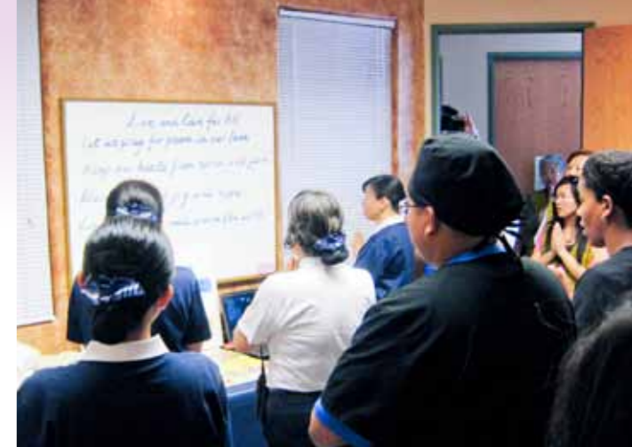
■ 大家開口合唱英文版的「愛與關懷」，跨越了語言的障礙。