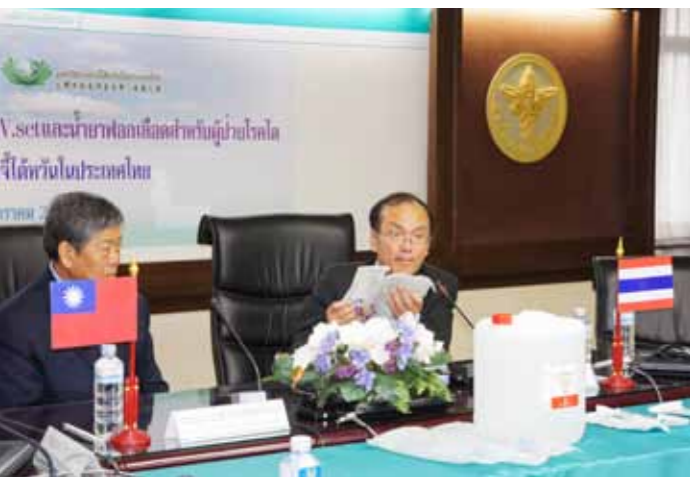
■ 藥政署署長吳進醫師（右）表示：「對於每星期需要洗腎二至三次的病人來說，這些洗腎液、點滴輸液和生理食鹽水，都是搶救他們生命的工具。」