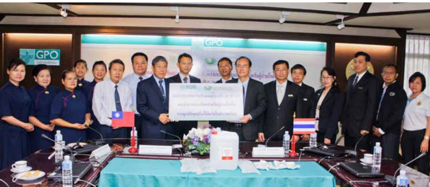
■ 此次援助泰國水患的洗腎輸液、醫材，一秉慈濟及時、直接、重點、尊重、務實的賑災原則。

泰國藥政署會將慈濟所捐贈一萬人次使用的洗腎液、三萬袋生理食鹽水和六萬套點滴輸液，全部捐贈給泰國腎臟基金會。因為從水災發生之後，該基金會都有調查詳細的資料，每個星期均進行會議，瞭解最新的狀況。為了不讓洗腎病人受到影響，該基金會不僅會援助淹水的地方，更將洗腎配方優先提供給設立臨時收容中心的醫院，補足所需要的部份，讓資源可以得到最妥善的運用。