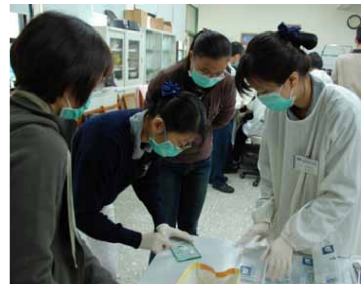
■ 為了讓院生獲得最好的治療，人醫會醫護人員細心準備醫療用品。

人醫會後，愈做愈快樂，雖然每天在自己執業的診所裡工作相當繁重，卻十分關心並期待人醫會的各項活動推動。