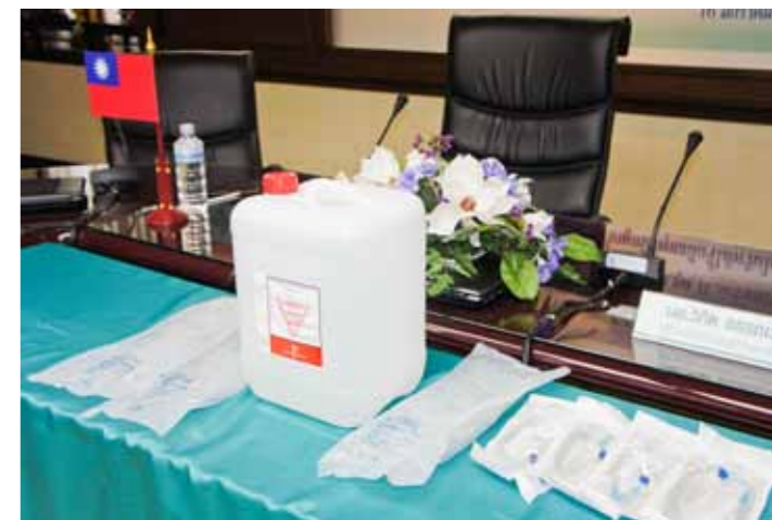
為協助因水災所苦的泰國洗腎患者，慈濟捐贈了可供一萬人次使用的洗腎液、三萬袋生理食鹽水和六萬套點滴輸液。

吳醫師表示，每次洗腎，每個病人需要使用三袋一千毫升的生理食鹽水、一套點滴輸液和兩加侖洗腎液。舉一個真實例子，泰國武裡南府和清萊府，這些地區雖然沒有被水淹，但也有缺乏生理食鹽水的現象，洗腎病人無法正常洗腎。再過幾個星期，如果依然沒有洗腎，他們的生命就會面臨危機，尤其是