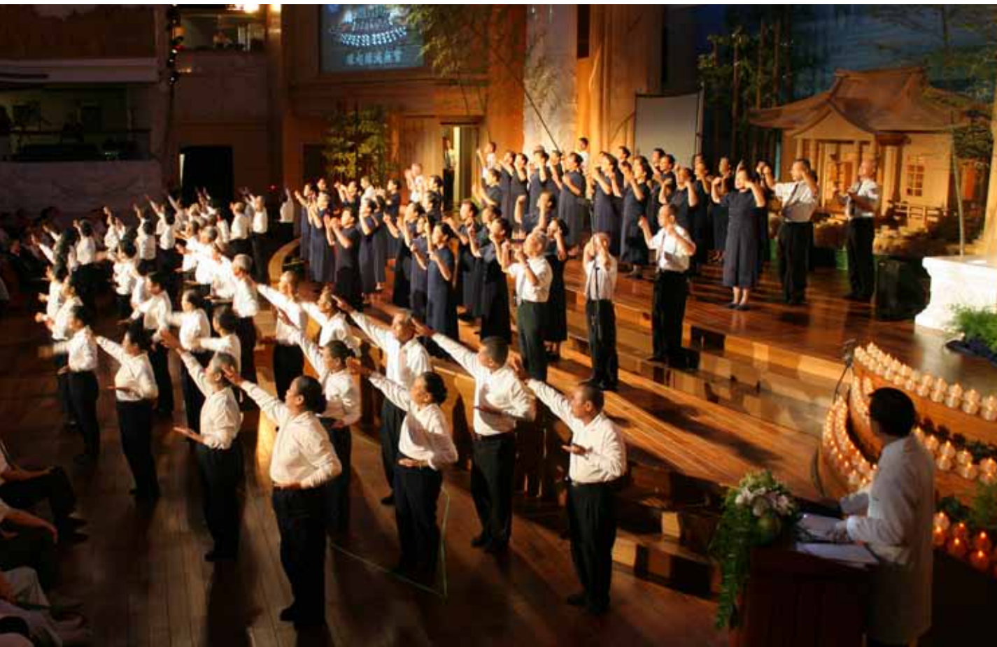
資深醫療志工上臺表演「一性圓明自然」，獻給勞苦功高守護生命的醫院同仁。