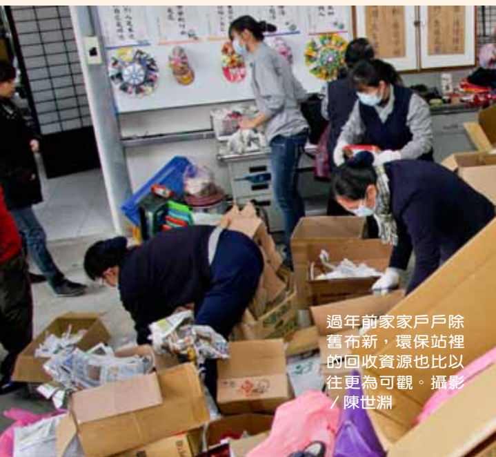
過年前家家戶戶除舊布新，環保站裡的回收資源也比以往更為可觀。

看著同仁們發揮現代愚公的本事，張院長說，「透過親身體驗，讓我們真正看到每天製造了多少的垃圾，所以大家要時時提醒自己別忘記『清淨在源頭』，將可利用的資源清洗乾淨再回收。」加入資源回收的行列，力行愛物惜福，也讓自己的心靈更清淨。