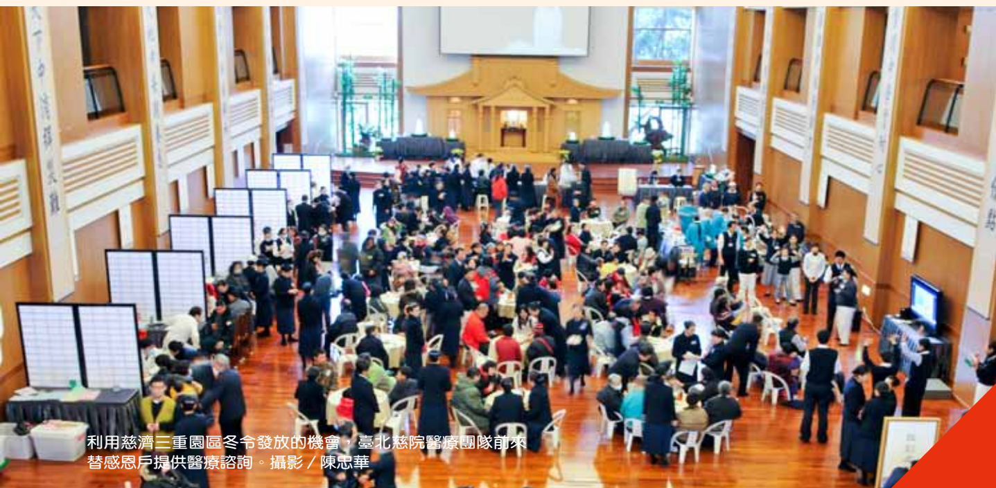
利用慈濟三重園區冬令發放的機會，臺北慈院醫療團隊前來替感恩戶提供醫療諮詢。