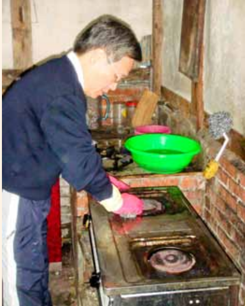
簡院長選擇了污垢最厚的廚房，拿著鋼絲絨取代清潔劑顧環保，賣力的刷洗。