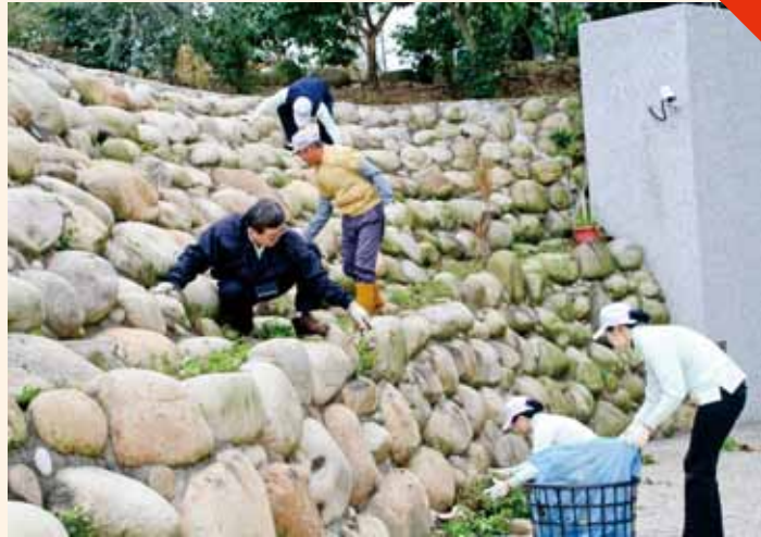
醫護人員爬上石頭鋪成的的斜坡，連石頭夾縫間的野草也都一一拔除乾淨。

今年院慶、藥師節、醫檢師節和歲末祝福結合從環保出發，同仁走出醫院走入社區，照顧環保志工的身體也促進自己的健康，身心靈都除舊布新。