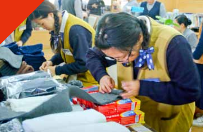
醫護同仁與志工們分工合作，仔細的將各式物資裝袋打包。