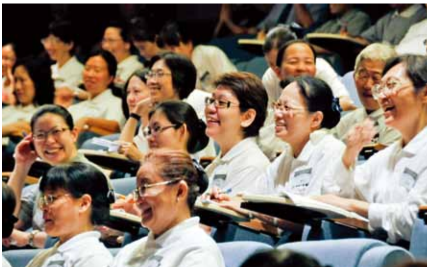
■ 來自二十三個地區與國家的人醫會成員，專心聆聽聯合報羅國俊總編輯分享「好新聞」。

就如簡院長提到的，一位缺乏人文精神的醫生，就只是一位醫匠。身為一位醫師，可以只是一號一號地，一天看一百多號病人；但也可以成為對社會有貢獻的良醫。媒體記者也是一樣，我可以只是每天寫出一篇篇的報導，我也可以成為一位有價值的新聞工作者，對於社會的改善與進步，盡自己一分力量。謹以此故事，與醫療、媒體工作者共勉之，感恩。🌱