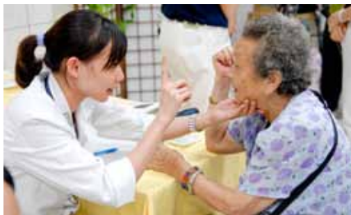
■ 醫師仔細的幫阿嬤檢查神經功能。