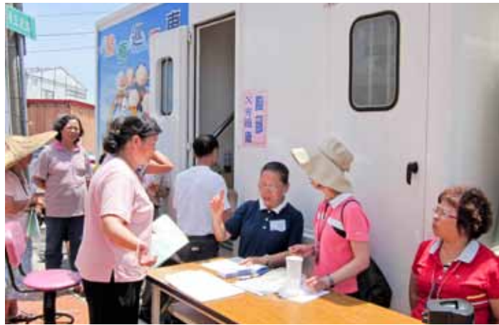
■ 豔陽高照的好天氣，讓民眾樂意參加臺中慈院和衛生局舉辦的整合性篩檢。

跟往年不同的是，過去臺中慈院是配合臺中縣衛生局提供人力支援，但是今年獨力統籌人力、物力，承接下臺中縣大里市、潭子鄉、后里鄉總計六場大規