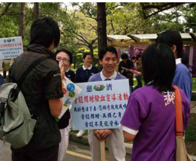
■ 新竹骨髓捐贈捐髓驗血活動宣導，慈青向往來學生宣導驗血活動。

接下三天我依然躺也不是坐也不是，在無菌室中睡眠品質、吃東西及擦澡是最困擾我的三件事。隨著日子過去，黴菌感染連續發燒、口腔黏膜破壞、喉嚨疱疹疼痛及舌頭的破損，讓我的痛苦指數與日遽增，需借助抗生素及嗎啡才能減緩疼痛感。在無菌室的生活就像是苦行僧的修行，連口水都覺得是苦的。內心再次大聲嘶喊：「我是最強的無敵勇者，世間沒有任何事可以輕易擊倒我。」這樣的堅定信念，總能讓身處黑暗深淵中的我，再度奮力找到一絲光明契機。