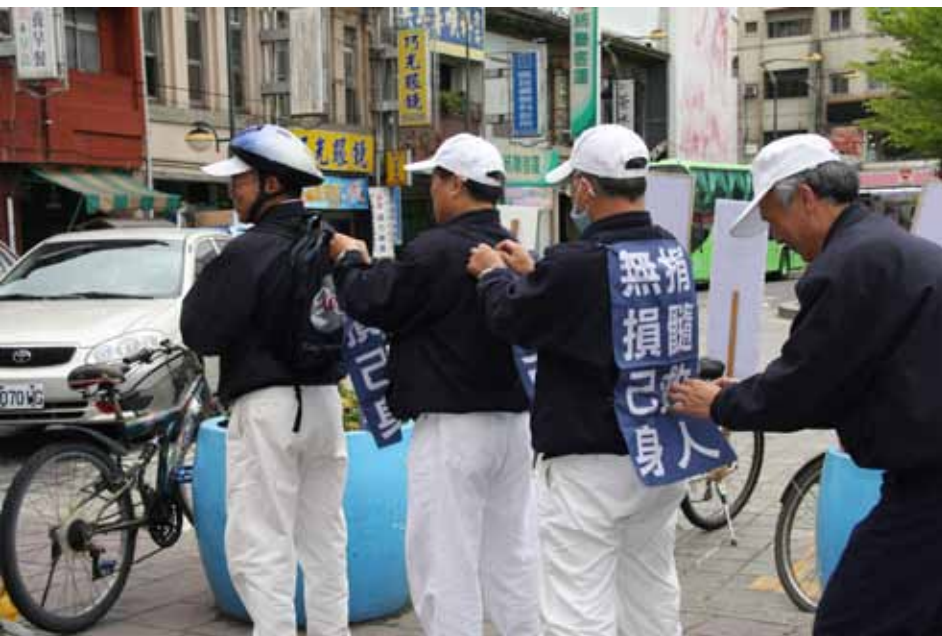
■ 彰化員林聯絡處舉辦「骨髓捐贈骨髓驗血活動」，骨髓捐贈關懷小組別出心裁想到將標語固定在身後的妙點子，騎腳踏車時就能變成行動看板，廣告周知。