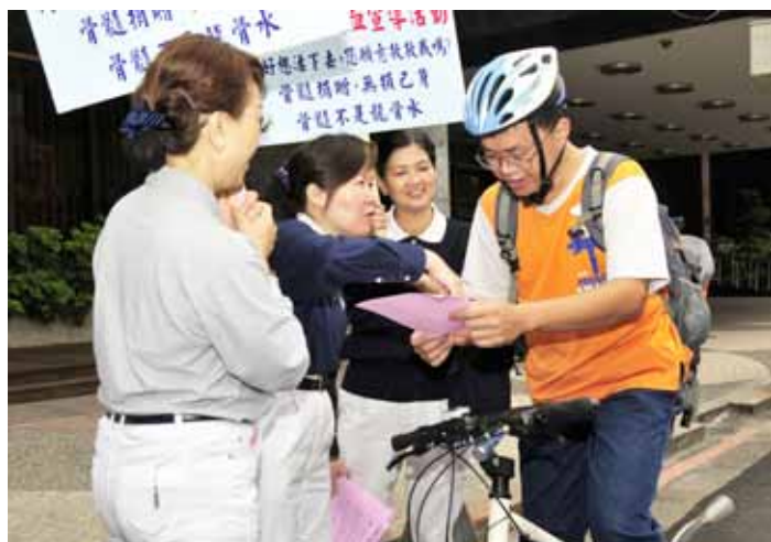
■ 每一個人、每十西西的血液都是希望，也因此慈濟志工不厭其煩的走上街頭，向來往民衆說明驗血活動的意義。