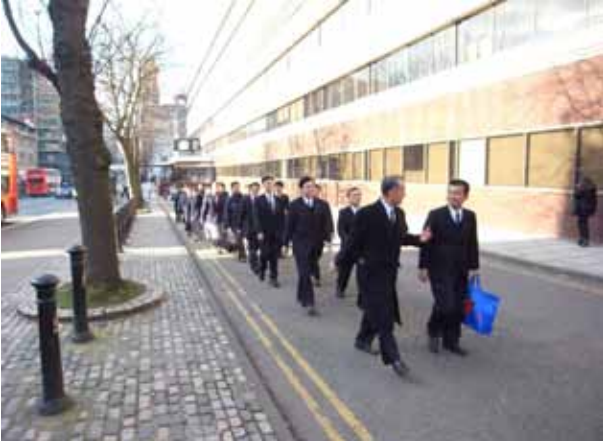
曼徹斯特街頭整齊的慈濟隊伍，用步行的方式前往參加第十八屆健康促進醫院年會。

四月份的英國，冷冽的空氣中散發著初春氣息，樹枝上正冒出翠綠的枝芽，草原上亦鋪展著綠油油的草皮，雖然平均氣溫不到十度，但暖暖的陽光灑在身上，真是舒服極了！連長年居住在英國的慈濟人都說，慈濟代表團來訪的這段時間，是英國難得一見的好天氣呢。