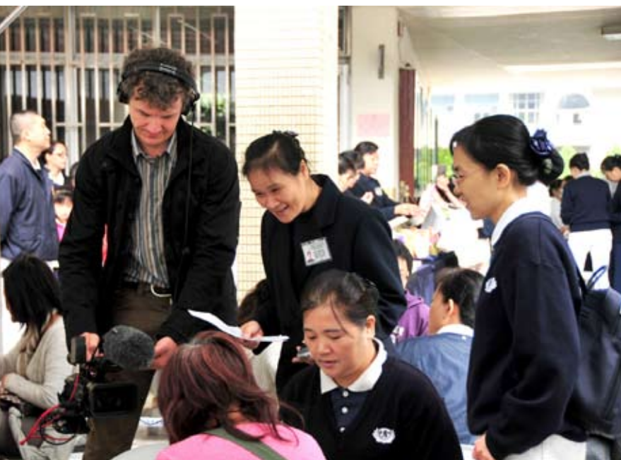
■ 慈濟志工舉辦的捐髓驗血活動，是一段骨髓移植完成前許多善心的默默付出，常常也是許多故事的起點。記錄這些動人的情節，是派崔克此行的目的。

派崔克表示，在荷蘭並沒有骨髓驗血活動，只有捐血活動，而且是非常制式化的，捐血者來到醫院，拿了號碼牌，就在一旁等待，輪到自己的號碼後，抽完血，就回家了，現場沒有志工，也沒有任何的互動。