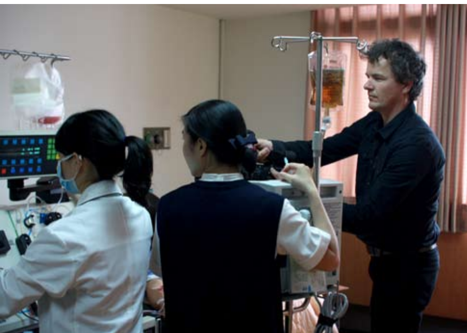
■ 派屈克此行順利拍攝了志工、醫護人員以及捐贈周邊血幹細胞的愛心民衆，讓身為佛教徒的他深深佩服慈濟志工在臺灣推動骨髓捐贈的努力，以及成就一份清水之愛背後細膩的愛心連線。