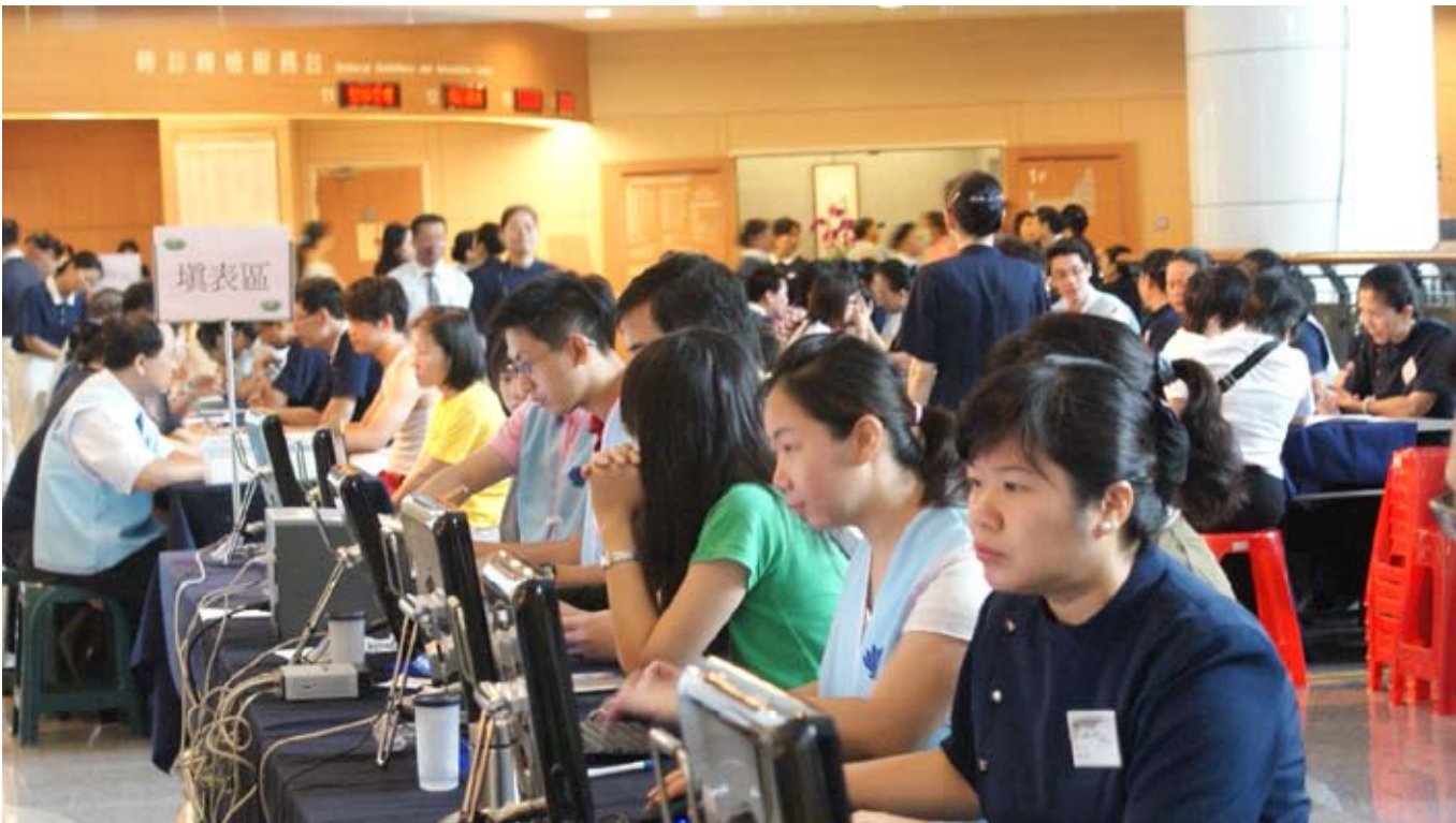
■ 骨髓捐贈驗血活動讓臺北新店區的志工動員起來，整個臺北慈濟醫院陽光大廳充滿發心捐血配對的人。

這個週末的震撼教育，給了我很大的啓示，面臨死亡即將到來的憂慮，或是擁抱生命契機的喜悅，並非吾等能準確預測或掌控的，重要的是如何提升「兩難抉擇」應變措施的處置與情境壓力下的紓解。感受生命無常的同時，宜「廣結善緣」「把握當下」，修福報，增助緣！