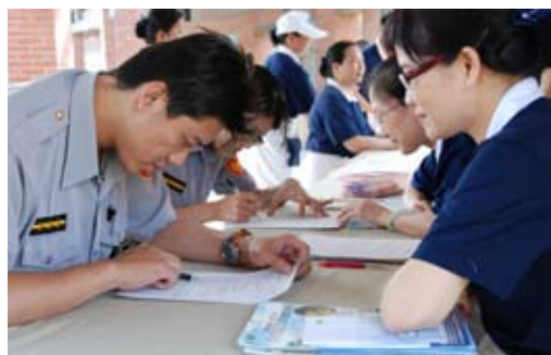
■ 新竹縣警察也發心響應慈濟的骨髓捐贈驗血活動，於解說填表區進行捐贈表單填寫。攝影／新竹曾鴻志

今天不過去了！很對不起，經過了一夜長考，基於妻子的身體狀況無法承受，而且家人給予的強大壓力，我們決定不捐了！」之後，我們在空中交談互動了半個多小時，這中間心情起伏震盪，時而平靜，時而大風大浪，聽似有望，卻又絕望現前！我拿著手機走進走出，忽站忽坐忽跪，淚水不時奪眶而出，這半