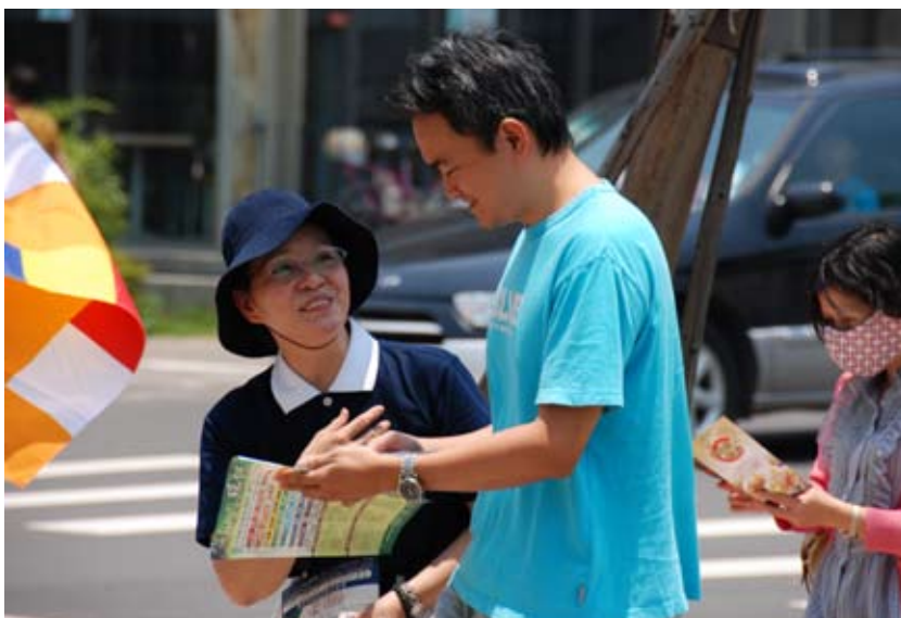
■ 慈濟志工頂著烈日對著路過的民眾說明活動的目的，以及邀請他們一同響應骨髓捐贈。

身容易緊張，經多次量血壓均高於標準許多，她並不知有高血壓而未治療，近日氣候悶濕熱，她睡眠品質差，且又因生理期來臨，導致體能下降，內分泌失調，免疫力差，再加上施打了三劑生長激素所產生的身體壓力及骨骼酸痛、頭痛，統合了以上多種狀況與累積的壓力，已超過她身心的負荷。因此引發了她在那個週六下午的暈眩症，天旋地轉而暈倒在地，嚇壞了現場所有的人，尤其是她的丈夫及媽媽。