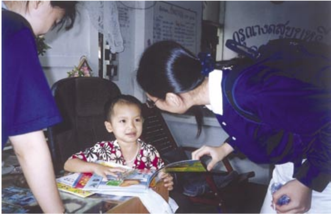
泰國的愛滋孤兒成了最年輕的難民。

的遺體，一袋袋布包的骨灰，疊成令人心酸的萬人枯塚。死亡的氣味，在狹小的空間當中，不斷竄流著。從一九九一年開始，泰國政府加強宣導保險套防治的效果，使得HIV感染的發生率逐年下降。但是病患的治療以及愛滋孤兒的照顧，才是現今泰國政府所要迫切解決的問題。